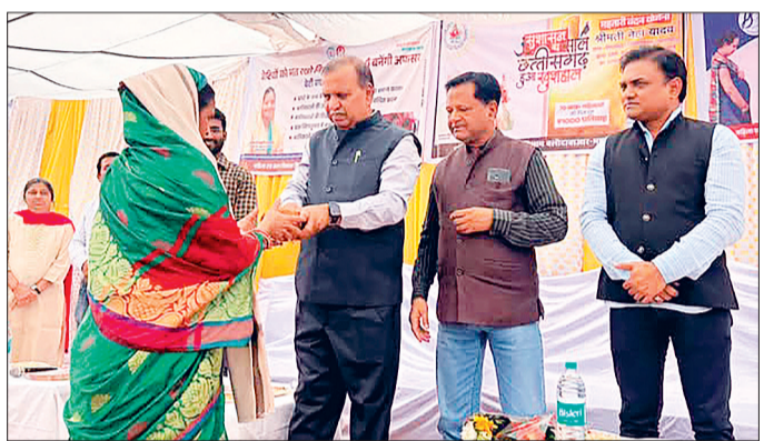
युवाओं के उत्थान के लिए निरंतर कार्य कर रही है। मोदी की गारंटी के अंतर्गत राज्य सरकार ने एक वर्ष के भीतर ही अपने बहुत से वायदों को पूरा किया है और आने

प्रधानमंत्री नरेंद्र मोदी के मार्गदर्शन एवं मुख्यमंत्री विष्णु देव साय के नेतृत्व में छत्तीसगढ़ भाजपा सरकार द्वारा शुरू की गई महतारी वंदन योजना ने महिलाओं को न केवल आर्थिक रूप से मजबूत किया है, बल्कि उन्हें आत्मविश्वास और आत्मनिर्भरता की दिशा में भी प्रेरित किया है। इस योजना के माध्यम से प्रदेश की 70 लाख महिलाओं को प्रतिमाह 1000 रुपये की आर्थिक सहायता मिल रही है। माताओं-बहनों के स्वाभिमान, सम्मान और उन्हें आर्थिक रूप से सक्षम बनाने का लक्ष्य लेकर हमारी भाजपा सरकार काम कर रही है।