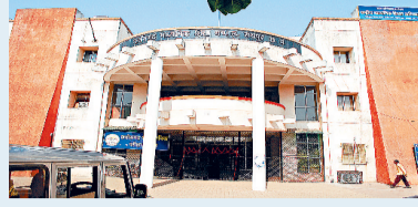
लगभग 70 ऐसे मामले, जिसमें छात्रों ने कई वर्ष पहले दिलाई थी नवमी की परीक्षा

अब माशिम द्वारा इन स्कूलों को खत लिखा जाएगा। उनसे बच्चों की इच्छा पूछी जाएगी। यदि विद्यार्थी प्राइवेट परीक्षाओं के रूप में शामिल होने की इच्छा रखते हैं तो उनके आवेदन को नियमित छात्र के कैटेगरी से हटाकर स्वाध्यायी छात्र के कैटेगरी में डाला जाएगा। यदि विद्यार्थी इसके लिए सहमति नहीं देते हैं, तो उनके आवेदन को निरस्त माना जाएगा। स्वाध्यायी परीक्षाओं के रूप में शामिल होने की सहमति देने वाले विद्यार्थियों से फॉर्स की अंतर राशि ली जाएगी।